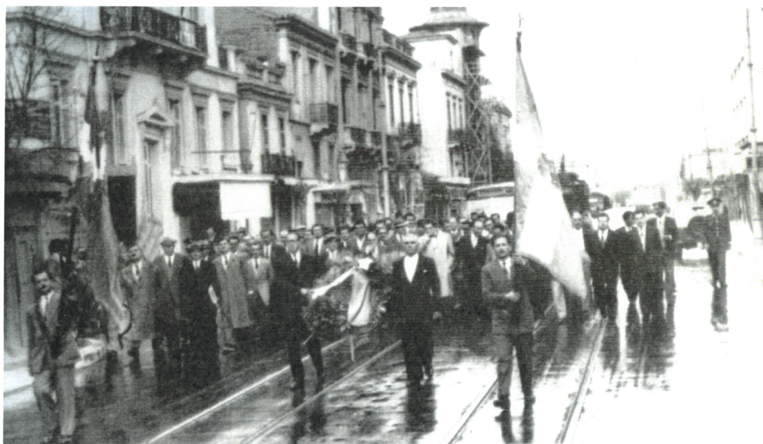
Ιδρυτικό Συνέδριο: Κυριακή 3 Απριλίου 1955. Πορεία προς κατάθεση «Στεφάνου εις Μνημείον Αφανούς Ναΐτου, Πλατεία Τερψιθέας Πειραιώς»

Η ανάγκη της συλλογικής αντιμετώπισης των προβλημάτων των εργαζομένων συσπειρώνει τους εργαζόμενους όλων των πρωτοβάθμιων σωματείων του κλάδου, πρωτοστατώντος του ΠΡΟΜΗΘΕΑ, στη δημιουργία δευτεροβάθμιου συνδικαλιστικού οργάνου της «ΠΑΝΕΛΛΗΝΙΟΥ ΟΜΟΣΠΟΝΔΙΑΣ ΠΡΟΣΩΠΙΚΟΥ ΕΤΑΙΡΕΙΩΝ ΕΜΠΟΡΙΑΣ ΠΕΤΡΕΛΑΙΟΕΙΔΩΝ ΚΑΙ ΔΙΥΛΙΣΤΗΡΙΩΝ ΟΡΥΚΤΕΛΑΙΩΝ ΠΕΤΡΕΛΑΙΩΝ» Π. Ο. Π. Ε. Ε. Π. & Δ. Ο. Π.